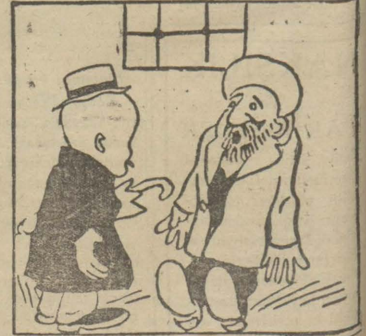
4: Hasan Bey — Sen hiç rutubetten korkar mısın? Ben büyük yap, kendini arşı âlâda zannet, otur ağağı!