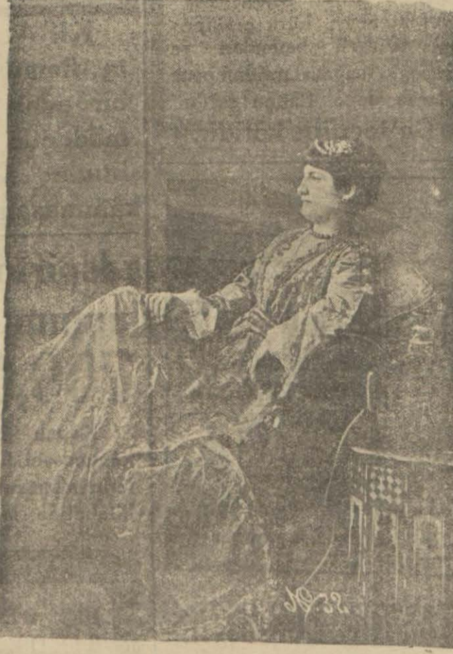
O zamanki Abdülhamit sarayının gözde bir kalfası istirahat ediyor