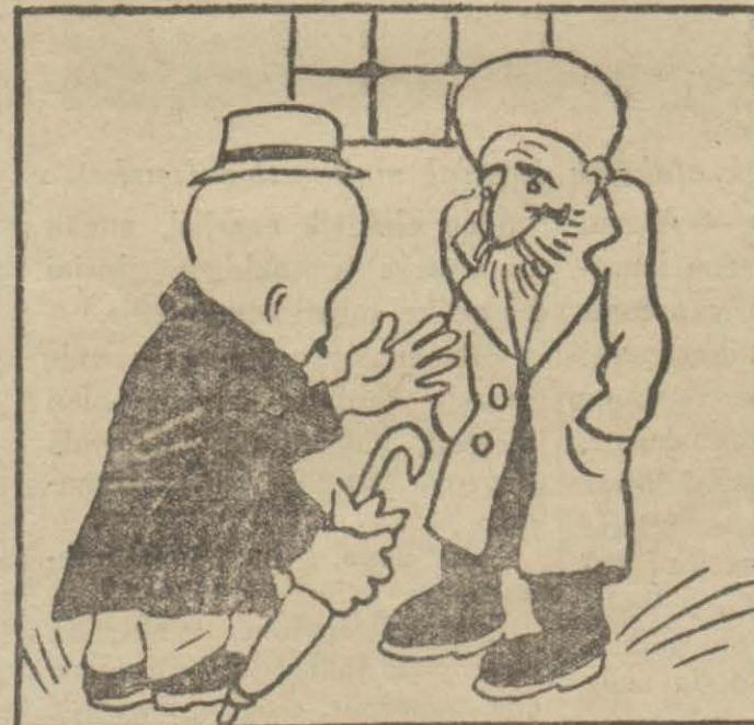
3: Hasan Bey — Hani sizin gibilere kurşun işlemezd, rutubet nasıl işliyor?